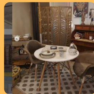
DT DETALLES C/ Església 256