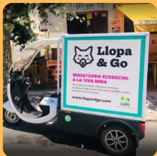
LLOPA & GO C/Jovara 218