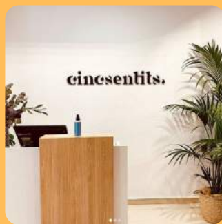
CINC SENTITS C/ Amadeu 98