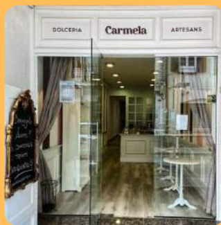
DOLCERIA CARMELA C/ Indústria 89