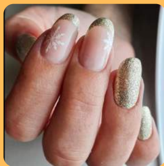
V&N NAILS C/ Sant Antoni 6-8