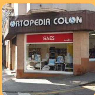
ORTOPÈDIA COLON C/ Romaní 65