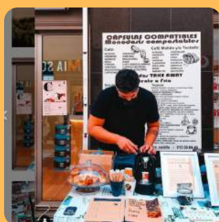
ITALY COFFE TEA STORE CALELLA C/Església 164