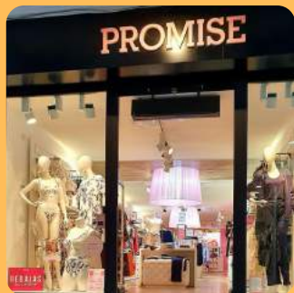
PROMISE C/Església 112