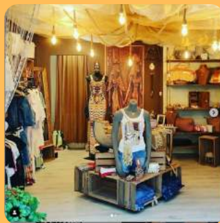
EL COFRE DE ISIS C/Sant Josep 43